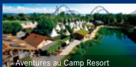
Aventures au Camp Resort

Europa-Park – Le parc de loisirs familial préféré en Europe · Info-Line +49 7822 860-5679 · www.europapark.de